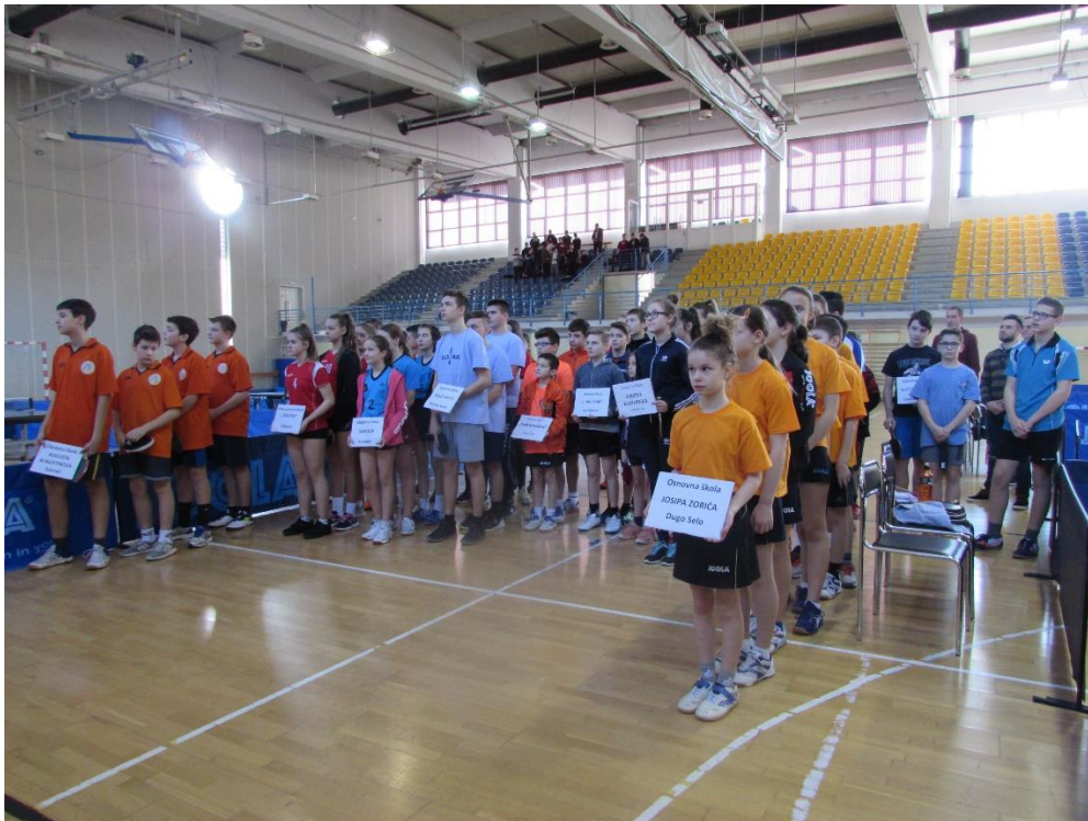
Natjecatelji na otvorenju natjecanja